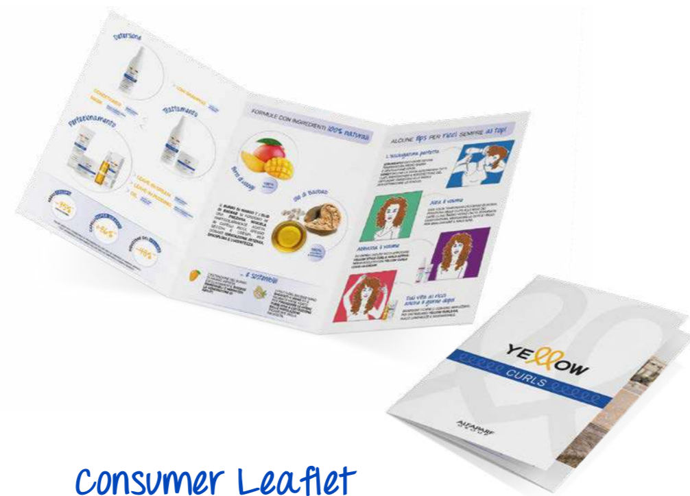
Consumer Leaflet OS NOSSOS SEGREDOS PARA TER SEMPRE CARACÓIS PERFEITOS!