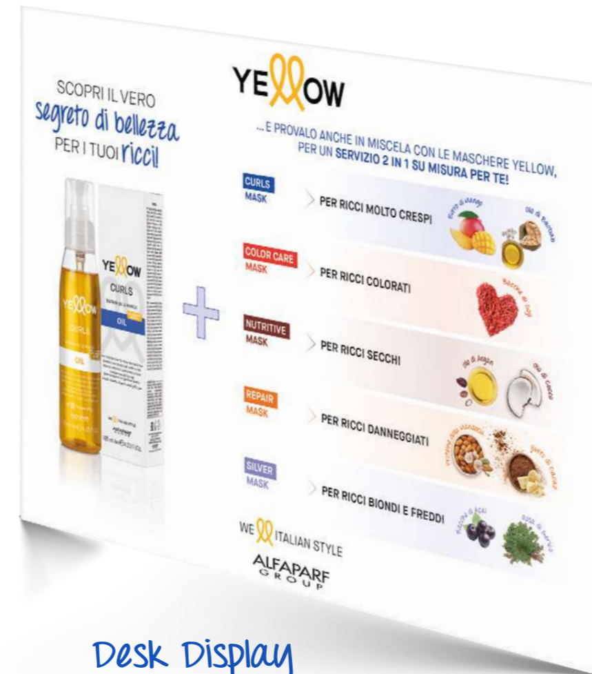
Desk Display PARA DESPERTAR A CURIOSIDADE DOS SEUS CLIENTES E INCENTIVAR A REVENDA.