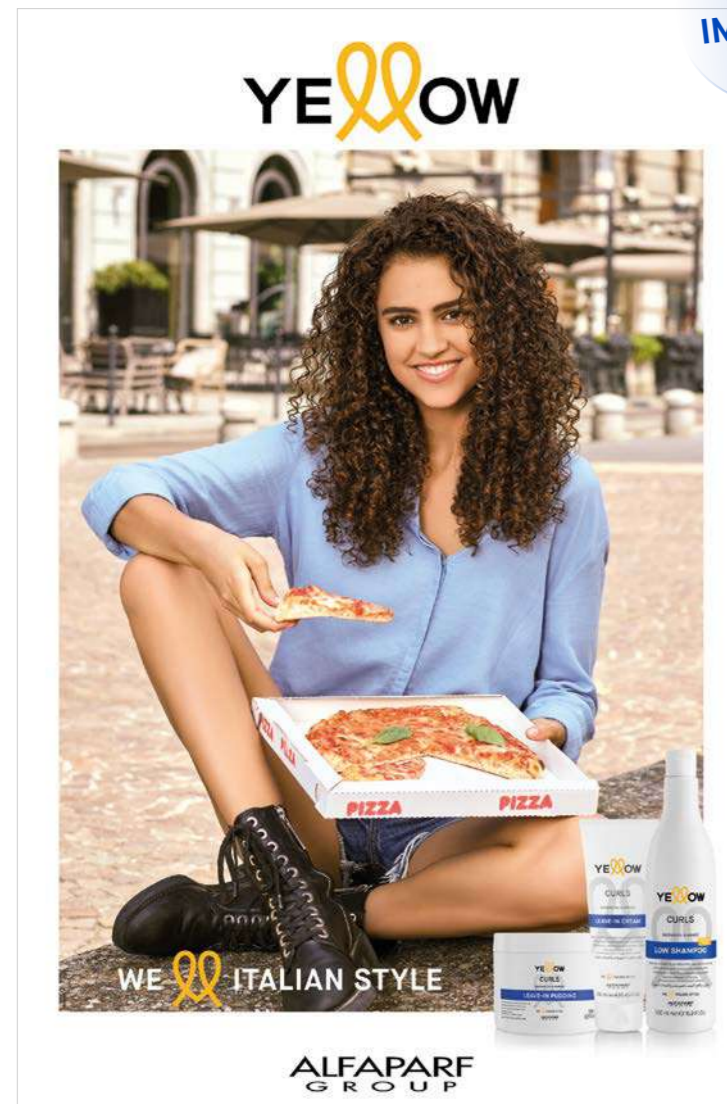
Poster 70 X 100 CM