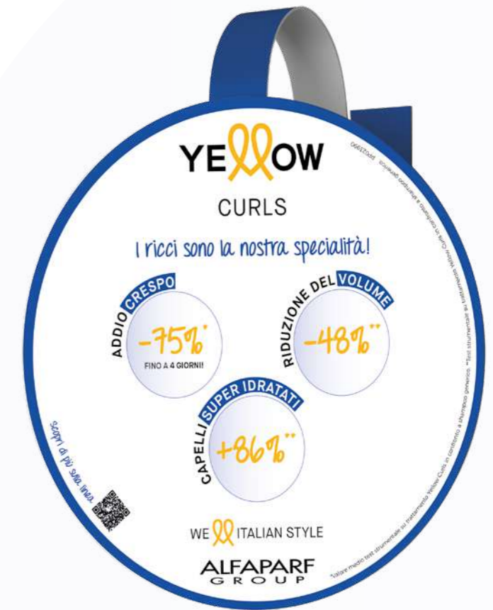
Shelf Pop up PARA TORNAR BEM VISÍVEL A LINHA NO EXPOSITOR.